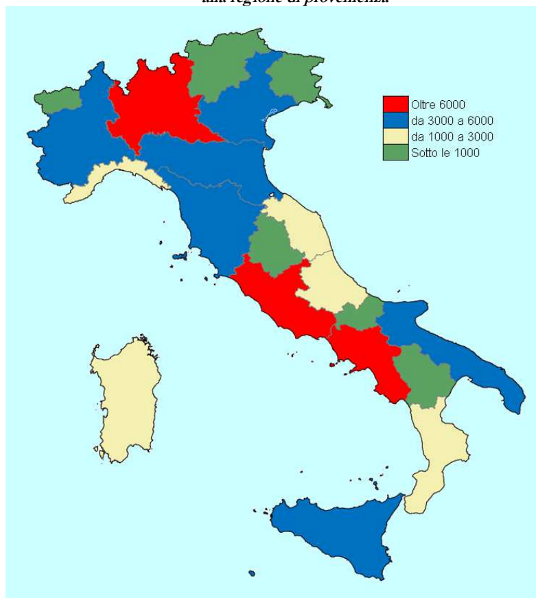
Ripartizione geografica delle segnalazioni in base alla regione di provenienza