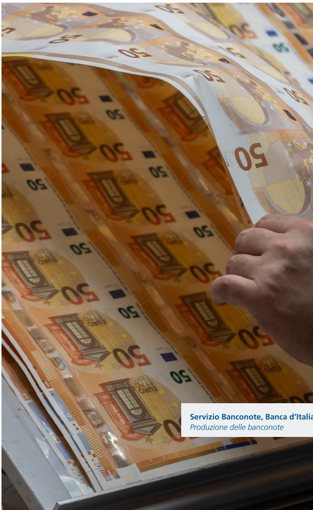
Servizio Banconote, Banca d'Italia Produzione delle banconote