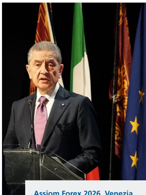
Assiom Forex 2026, Venezia L'intervento del Governatore della Banca d'Italia

Nel corso del 2025 la Banca d'Italia ha svolto analisi ad ampio spettro sulla vulnerabilità di imprese e famiglie, sulla qualità dei prestiti bancari, sui rischi connessi con l'andamento del mercato immobiliare e su quelli derivanti dall'attività degli intermediari non bancari, nonché sul possibile impatto dei cambiamenti climatici e della digitalizzazione dell'industria finanziaria. Ha inoltre partecipato alla discussione sulla stabilità finanziaria nelle varie sedi di cooperazione internazionale. Sono proseguite le valutazioni sull'adeguatezza delle riserve macroprudenziali di capitale richieste alle banche.