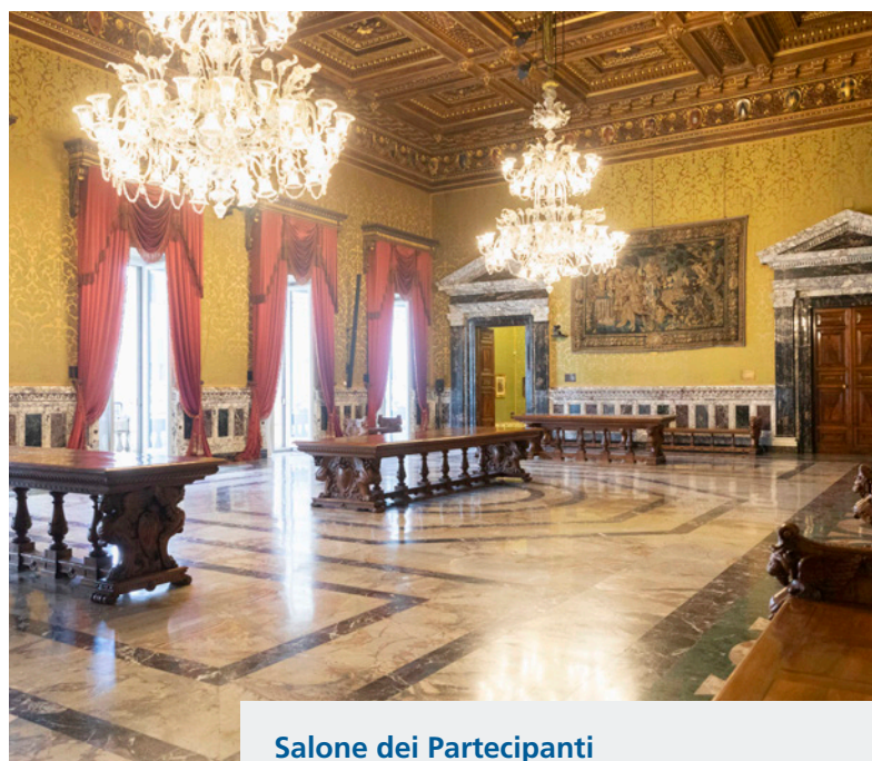
Salone dei Partecipanti Roma, Palazzo Koch

È proseguito il processo di razionalizzazione e rinnovo del patrimonio immobiliare della Banca. Comprese le cessioni effettuate nel 2025 (cinque ex Filiali e un alloggio), le dismissioni avviate dal 2014 sono arrivate a interessare circa i tre quarti degli immobili non più utilizzati per fini istituzionali a seguito delle diverse riforme della rete territoriale (per un corrispettivo di 212 milioni di euro a fronte di un valore di bilancio pari a 190 milioni di euro). Sono inoltre continuati i lavori per ridisegnare gli ambienti di lavoro secondo il modello dello smart office che, insieme agli interventi di ristrutturazione, permetteranno in prospettiva di raggiungere una flessione del fabbisogno di spazi e dei relativi costi di gestione.