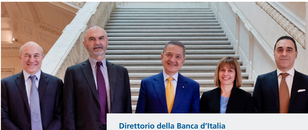
Direttorio della Banca d'Italia

Nel 2025 è cresciuto ulteriormente l'interesse del pubblico verso le statistiche diffuse dalla Banca d'Italia: sono aumentati di quasi un quarto i download delle pubblicazioni statistiche periodiche (da 817.000 a 1.009.000), di quasi un decimo gli accessi alla Base dati statistica (BDS, da 449.000 a 485.000). Sono state condotte oltre 25.000 interviste a imprese, famiglie e altri operatori economici. È proseguita con intensità la collaborazione con l'Istat per migliorare la coerenza tra le statistiche sull'estero e i conti nazionali. L'Istituto ha continuato a fornire un contributo rilevante ai progetti strategici dell'Eurosistema nella raccolta e compilazione delle statistiche monetarie, bancarie e finanziarie.